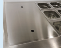
ALTAAN PEITEKANSI GN 1/1